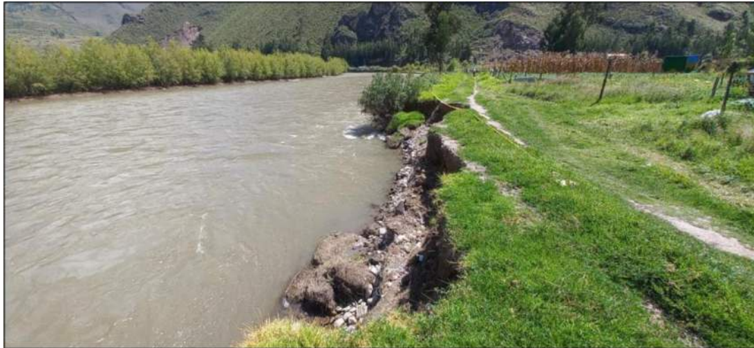
FOTOGRAFIA N°03: BASE DEL TALUD DEL RIO SE OBSERVA EL SOCAVAMIENTO Y EROSION DEL MISMO EL CUAL DEBILITA Y PODRIA AFECTAR LOS TALUDES DEL CAUCE ALEDAÑO A ZONAS DE CULTIVO.