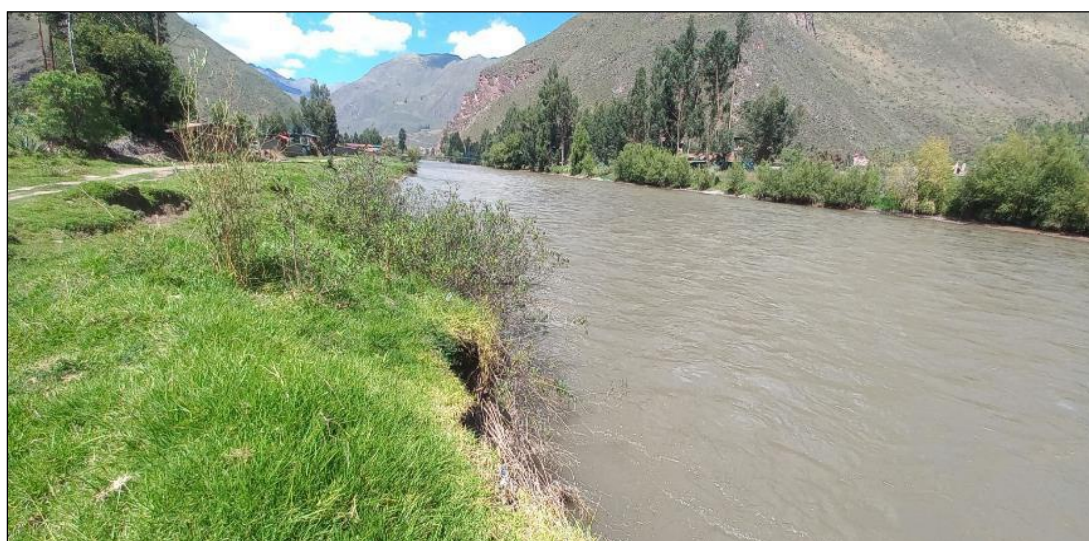
FIGURA N°02: BASE DEL TALUD DEL RIO SE OBSERVA EL SOCAVAMIENTO Y EROSION DEL MISMO EL CUAL DEBILITA Y PODRIA AFECTAR LOS PUENTES DEL CAUCE DEL RIO VILCANOT.