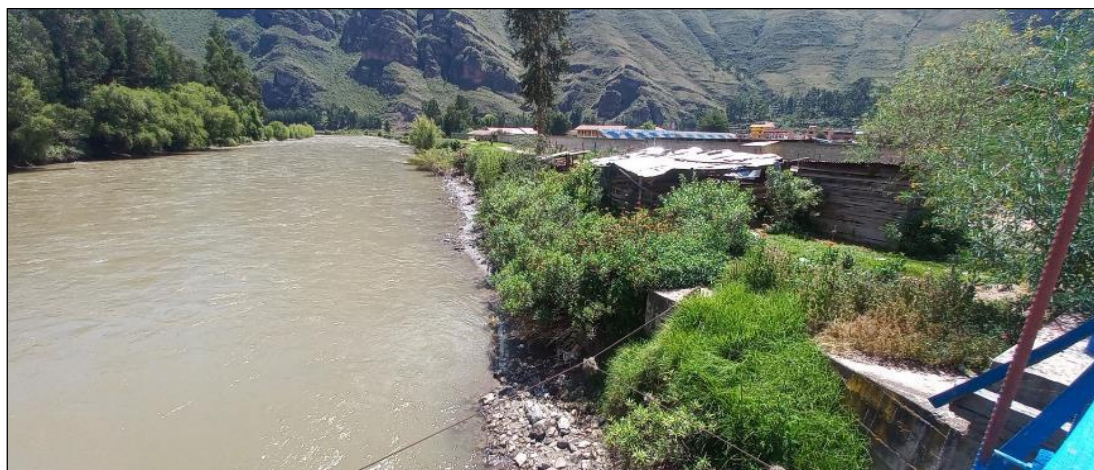
FIGURA N°01: BASE DEL TALUD DEL RIO SE OBSERVA EL SOCAVAMIENTO Y EROSION DEL MISMO EL CUAL DEBILITA Y PODRIA AFECTAR EL PUENTE E INSTITUCION EDUCATIVA CERCANA.